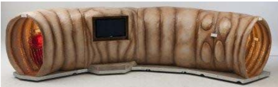
La maquette d'intestin géant