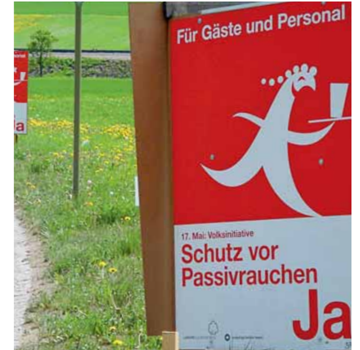
Volksabstimmung vom 17. Mai 2009

Über 40 Verbände setzen sich national mit einer Volksinitiative dafür ein, dass unsere regionale Lösung auch auf nationaler Ebene gelten soll. Es wird wohl noch eine Weile dauern, bis in unserem Land einheitliche und wirksame Lösungen gelten, die mit dem europäischen Umfeld vergleichbar sind.